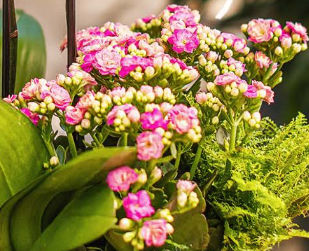
1 Cuia de Samambaia Havaiana Mini C13