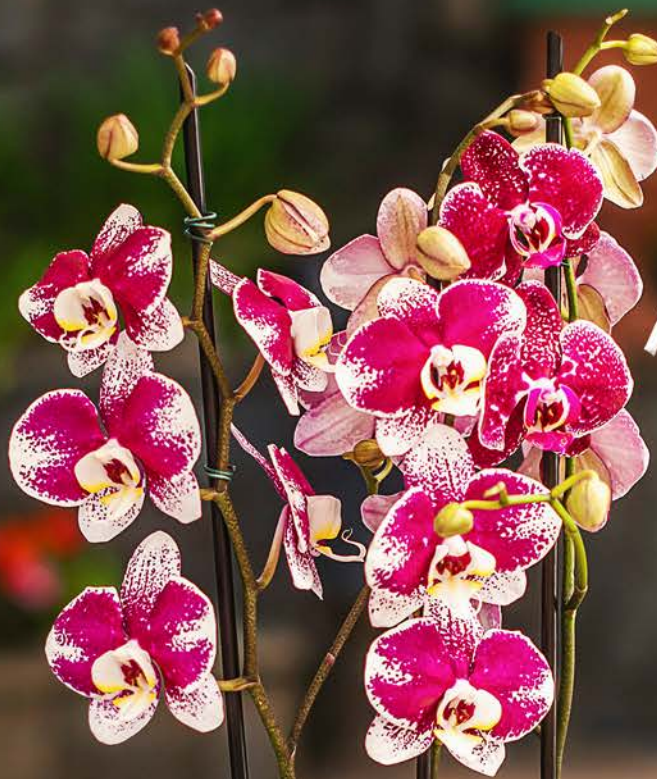
1 Vaso de Phalaenopsis Bicolor P12 2HT