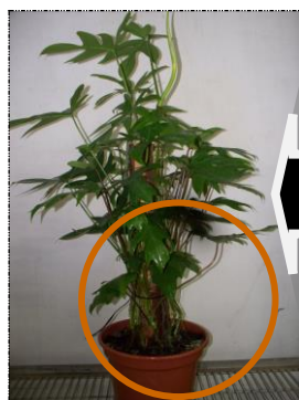
Plantas com má formação A2