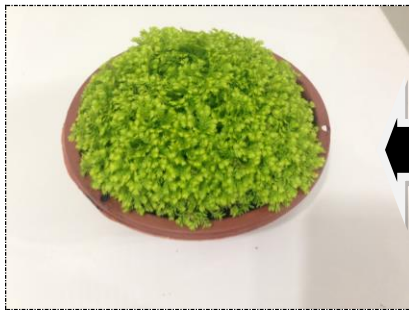
← Planta com boa formação

Os produtos comercializados nas Cuias e Potes deverão cobrir no mínimo 90% da superfície do vaso .