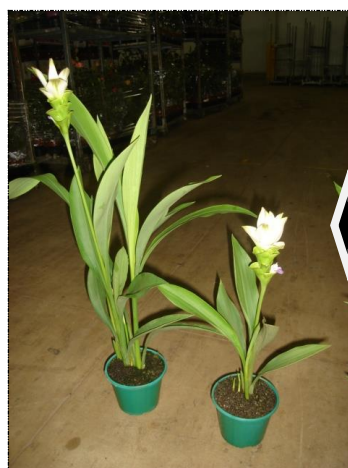
Lote desuniforme em altura