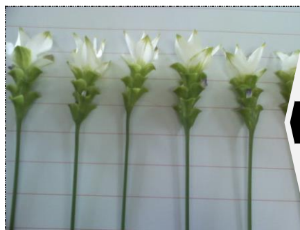
Uniformidade nas Hastes