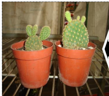
Plantas com má formação