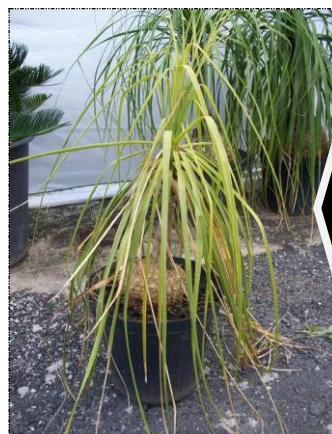
Plantas sem formação