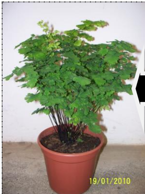
Planta com boa formação