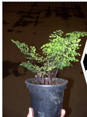
Planta com má formação