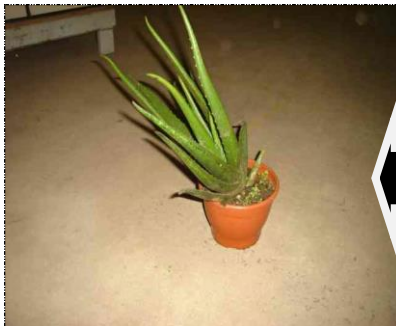
Planta com falta de sustentação

As plantas de Suculentas deverão apresentar uma boa formação sem falhas, apresentando uma constituição homogênea em toda a extensão do vaso, as hastes deverão estar firmes e com sustentação. Plantas sem sustentação serão devolvidas ao sítio.