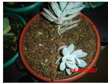
Plantas com má formação