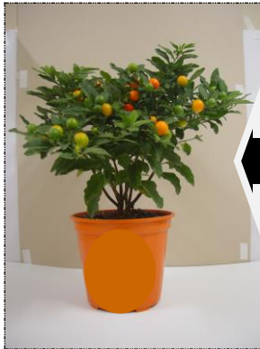
Planta com boa formação

O lote será devolvido ao produtor ou desclassificado para A2 desde que tenha condições ainda de comercialização.