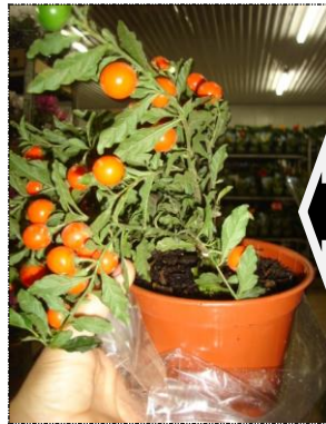
Planta sem sustentação