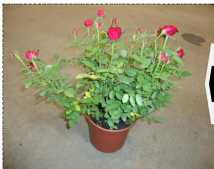
Planta com má formação

O vaso de Roseira Mini Importada deverá apresentar formações circulares, compactas, com folhas bem distribuídas pelo vaso. Com 95% de uniformidade.