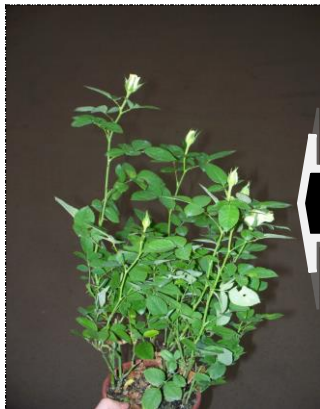
Planta muito alta