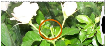
Poda mal feita

Danos mecânicos. Danos causados pelo rompimento ou deformação superficial do tecido da folha provocada por ação mecânica;