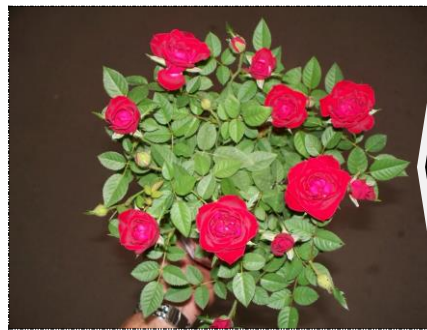
Plantas com boa formação