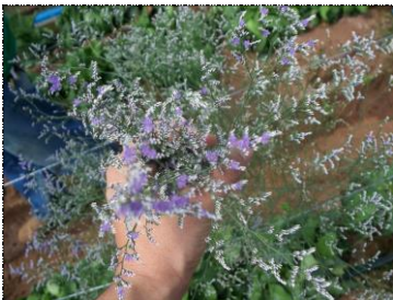
Botões e flores abertas (A1)