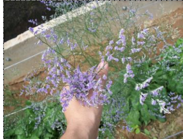
Botões abertas (A1)

OBS: Hastes que apresentarem somente aspargos (sem presença de flor) não serão comercializadas.