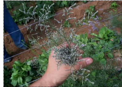
Botões com maturação e início de abertura (A1)