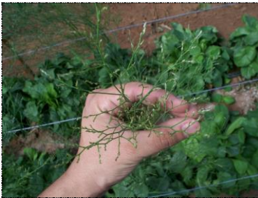
Botões imaturos (não comercializável)