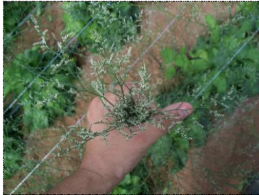
Botões com maturação (A1)