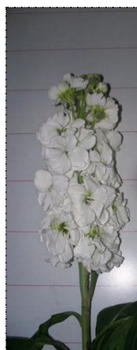
Flores abertas (A1)

Botões Deformados. Cachos florais com poucos botões devido à má formação deverão ser enviados como A2.