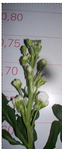
Botões imaturos (não comercializável)

Consideraremos excesso de maturação , a haste floral que apresenta um avançado estágio de maturação ou envelhecimento e apresentando flor aberta como aspecto de "flor passada". O produto sendo considerado com excesso de maturação para comercialização será devolvido ao produtor.