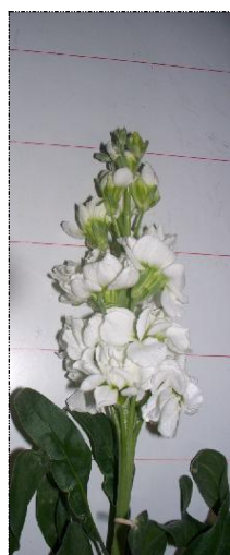
Botões e flores abertas (A1)