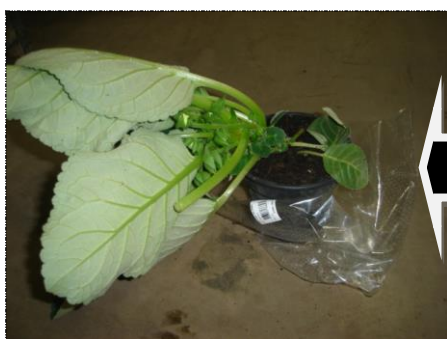
Planta sem sustentação