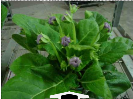
Botão mostrando a cor