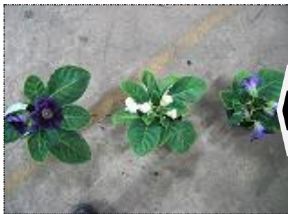
Plantas com má formação