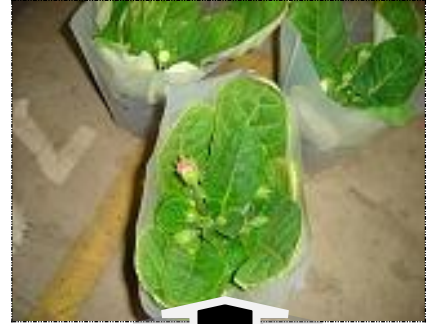
Falta de hastes