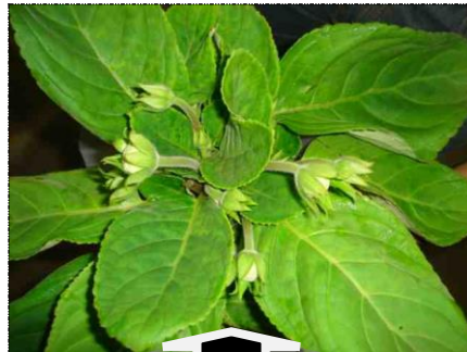
Falta de maturação