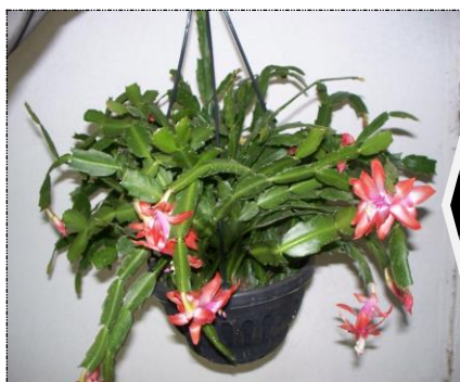
Plantas com Boa formação