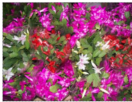
Até 30% de flores abertas no A1