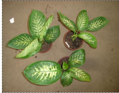
Plantas com má formação

Haste mole ou torta. Falta de sustentação da planta pela altura ou desvio de sua haste que descaracterizem o produto.