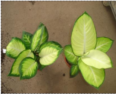
Plantas com boa formação