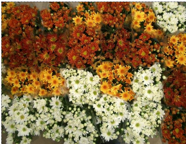
Ponto 1 com Ponto 2

Consideraremos uniforme o lote (camada ou carrinho) formado pela combinação dos pontos de abertura: Pontos 1 com 2 e 2 com 3 como mostra a seguir: