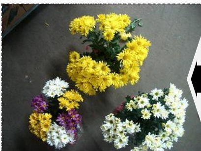
Plantas sem sustentação