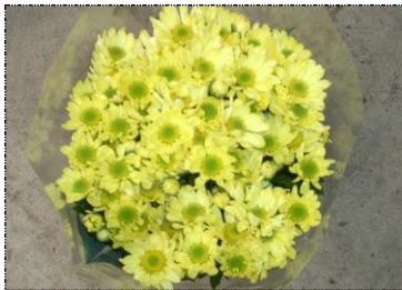
Ponto 1 (normal)