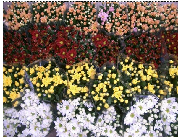
Ponto 2 com Ponto 3