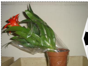
Planta sem Sustentação

A planta de Bromélia deverá apresentar uma boa formação, apresentando uma constituição folhear, homogênea e com boa sustentação.