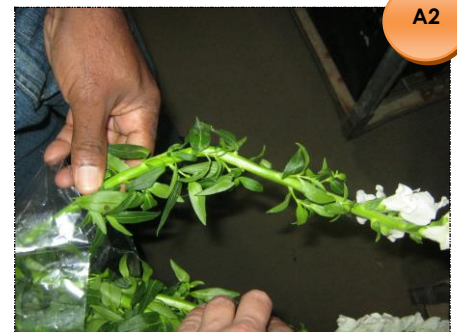
Hastes com ganchos - Devolução