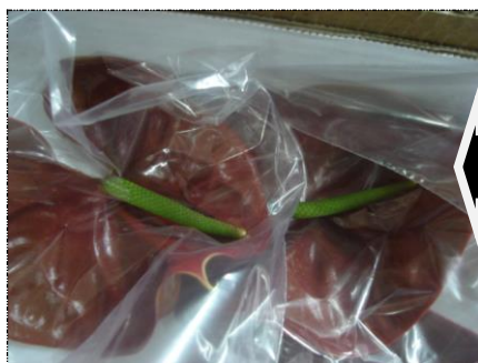
Falta de maturação